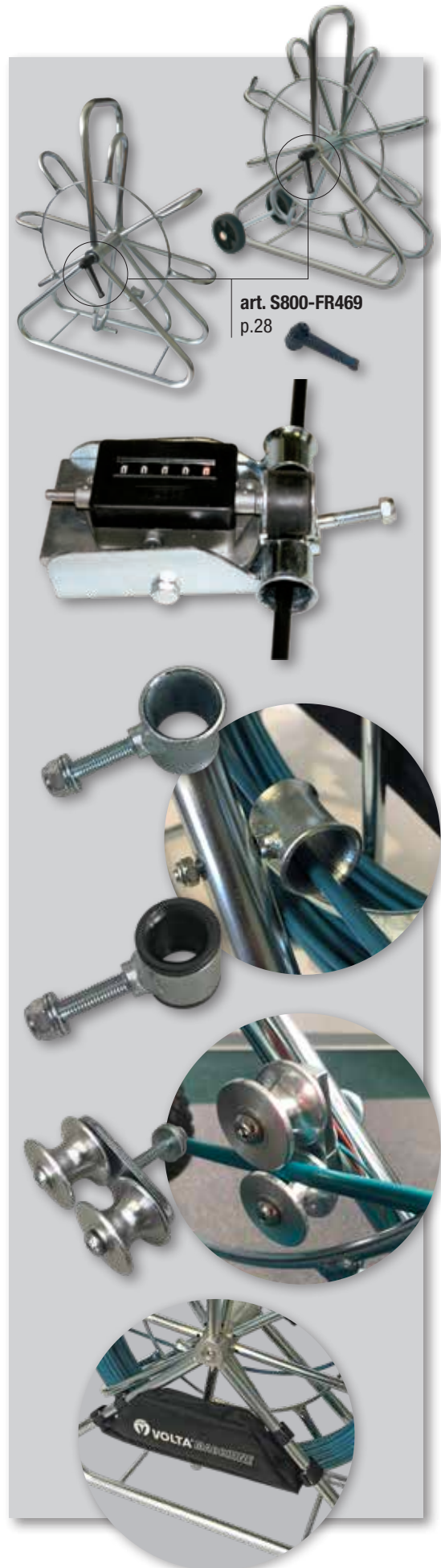
art. S800-FR469 p.28

Subject to technical changes without prior notice. Technische Änderungen vorbehalten. Sujeto a variaciones técnicas sin previo aviso. Soggetto a variazioni tecniche senza preavviso.